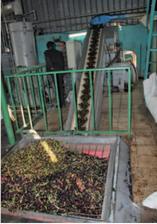
بعد نقلها للمعصرة تجمع للغسيل والعصير، ولتنظيف من الأوساخ المتبقية

ديسمبر - كانون أول، العدد (3) مجلة الإلكترونيّة نعني بشؤون البيئة نصد عن جمعية الحياة الخضراء