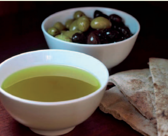
وأخيرا يتم نزول الزيت الصافي، ويصبح جاهزا للأكل والبيع بعد تعبئته