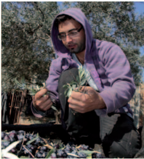
ومصطلح التبرية كان قديما يستخدم للقمح لازالة الأوساخ عن القمح، وتم اقتراض المصطلح للزيتون