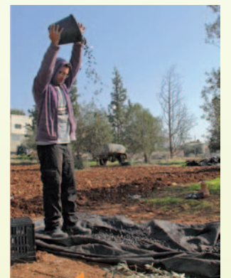
ثم يتم عن طريق الهواء فصل الزيتون عن الأوراق بما يعرف "بالتذرية"