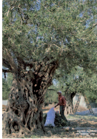
إن استخدام الأكياس البلاستيكية يعتبر من العادات الضارة، لما للبلاستيك من أثر ضار على الصحة الانسانية والبيئة