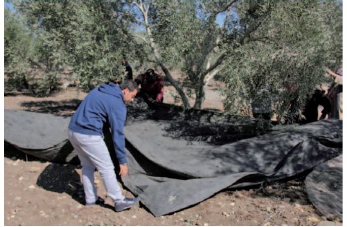
يبدأ قطف الزيتون بوضع المفاش تحت الأشجار حتى يسقط عليها الثمار