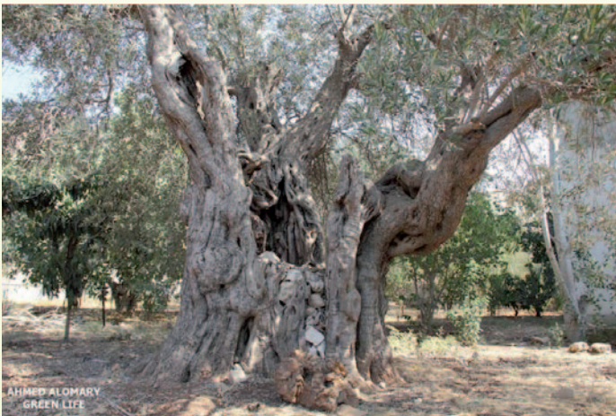
يلجأ الفلاحون الى ممارسات غريبة احيانا أثناء قطف الزيتون، وقد تكون ذات معتقدات شائعة وليست بالضرورة صحيحة.. كوضع الأحجار داخل الشجرة

تعبر شجرة الزيتون عن تراث الفلسطينيين وتبقى صامدة لأجيال عدة وتعتبر مصدر رزق بالنسبة لأصحابها