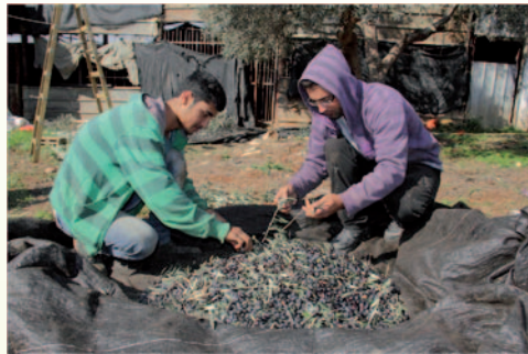
تبدأ العائلة بتنظيف اكوام الزيتون وإزالة الأوساخ والأوراق من بين حبات الزيتون، بما يعرف "بالتبرية"