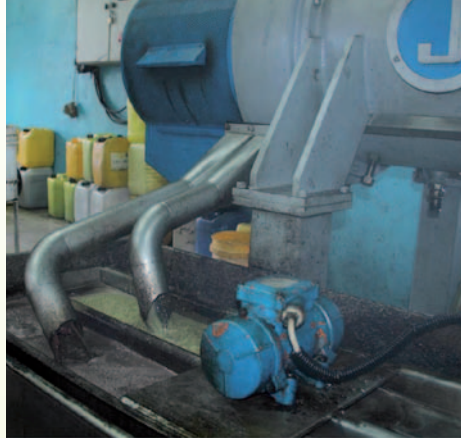
بعد جرش الزيتون داخل المعصرة يتم فصل المياه والزيت عن باقي اجزاء الثمار عن طريق عملية الطرد المركزي (الجفت والزيار)