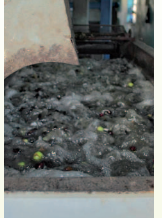
يغسل الزيتون داخل المعصرة من الأوساخ والغبار