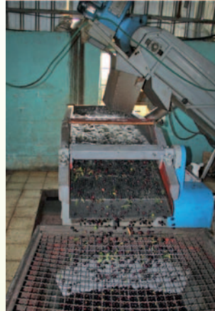
يصبح الزيتون جاهزا للعصر بعد غسله وتنظيفه