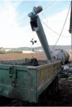
صورة 26: يتم إلقاء الجفت في الخارج بعد فصله عن الزيتون