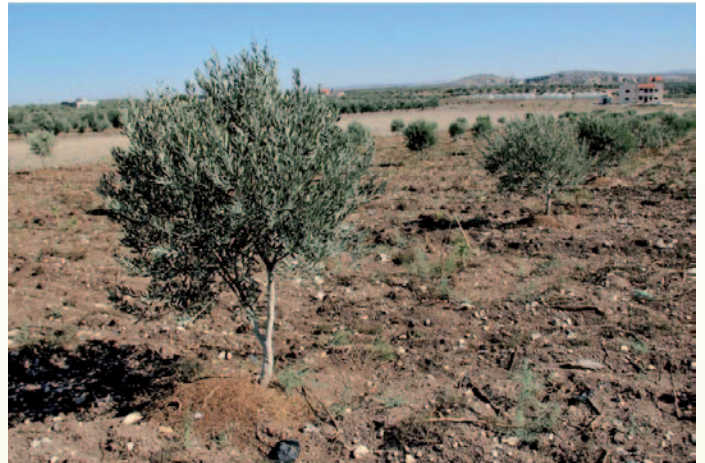
شتلة الزيتون وهي تحتاج الى ست سنوات حتى تبدأ بالثمار