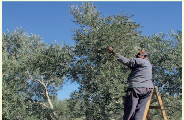
تسمى المرحلة الأولى من قطف الزيتون "بالخرط" وتستخدم السلالم من اجل الوصول الى فروع الشجرة العليا