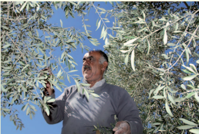
يعتقد أبو محمد من كفر قود أن عدم قدوم شتاء جيد في العام الذي يسبق القطف يجعل أوراق الشجر تبدو ناشفة، وحببات الزيتون صغيرة وسوداء