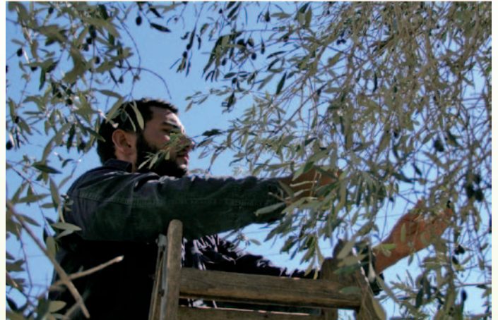
يبدأ القطف من منتصف تشرين أول ولغاية كانون الأول، وأن الشتاء السابق للقطف هو ما يقرر حسن الموسم من عدمه