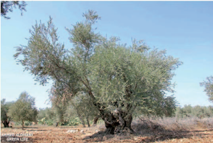
تعبر شجرة الزيتون عن تراث الفلسطينيين وتبقى صامدة لأجيال عدة وتعتبر مصدر رزق بالنسبة لأصحابها

تبدأ مراحل قطف الزيتون من الغرسة المقدسة، وحتى الزيت الذي يعتبر من أولويات حياتنا وغذائنا.