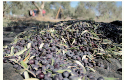
يجمع الزيتون على شكل اكوام صغيرة