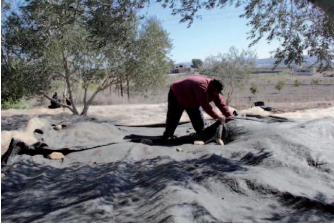
يتم تثبيت المفاش بأحجار ، حتى لا تطير وتحافظ على ما عليها من زيتون

ديسمبر - كانون أول، العدد (3) مجلة اللّثرونبة نعني بشؤون البيئـة نـصـدر عن جمعيـة الحياة الخـضراء