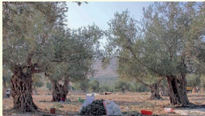
يتم تقليم الأشجار للحفاظ عليها، مما ينتج الأحطاب للشتاء، أو قد يكون غذاء للماشية