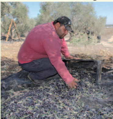
ثم يتم وضع الزيتون في أكياس الخيش أو البلاستيكية أو في الصناديق ليتم نقله للمعصرة