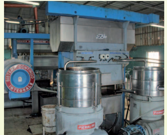
يتم بالفرازة فرز الزيت عن الماء