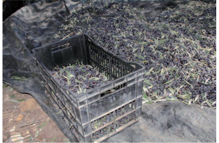
ثم يتم وضع الزيتون في أكياس الخيش أو البلاستيكية أو في الصناديق ليتم نقله للمعصرة